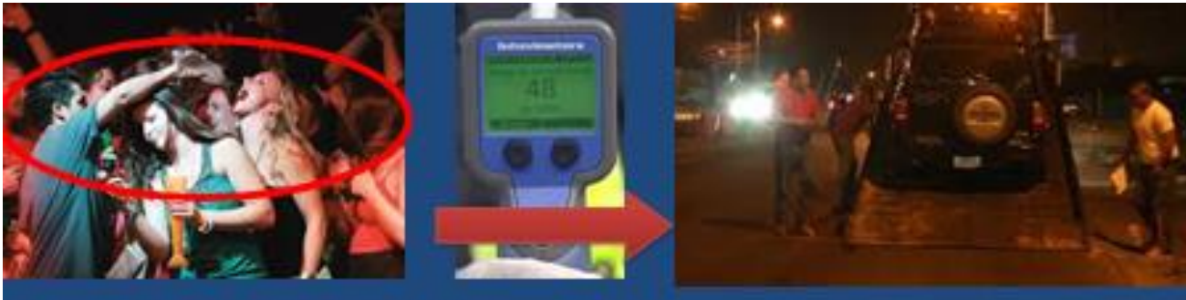
Ilustración de la Acción de Remolque